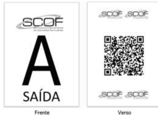
Ficha de saída