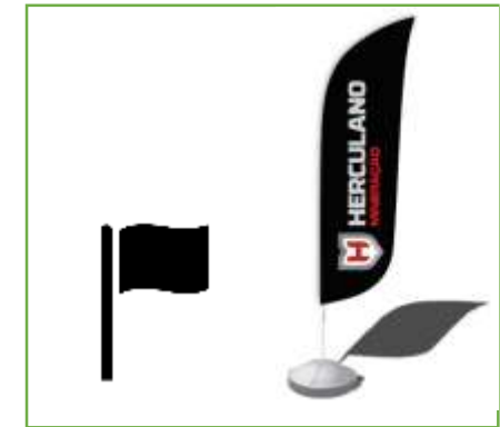
Todas as pilhas são identificadas com bandeiras ou wildbanner