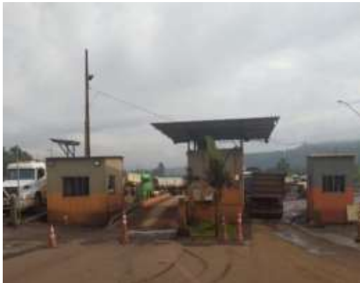
Portaria de acesso SCOF