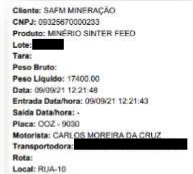
Ticket do motorista