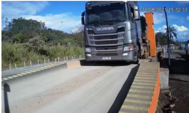
Carreta posicionada na balança

Todo o processo de pesagem rodoviária do terminal é feito de forma automática.