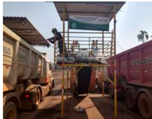
Plataforma de amostragem