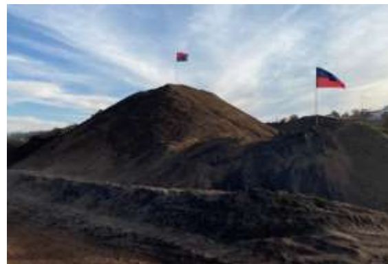
Identificação da pilha